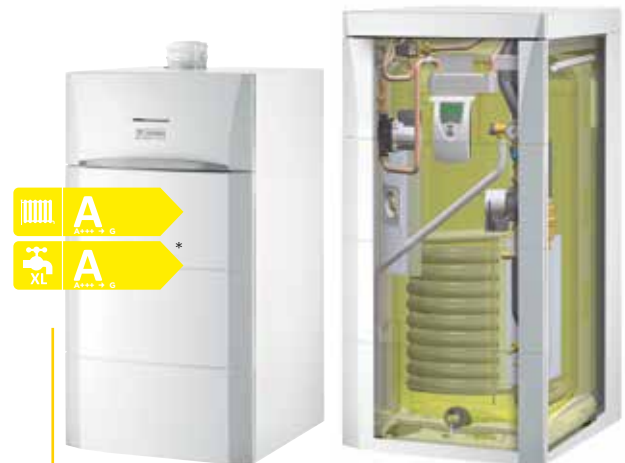
220 SHL Speicher beigestellt * inkl. 2 Sonnenkollektoren

... ein modulares Baukastensystem verschiedener Kessel und Speicher, die frei kombinierbar sind. Die Elemente lassen sich in Towerform kombinieren und erhalten durch eine passende Verkleidung ein klares Design.