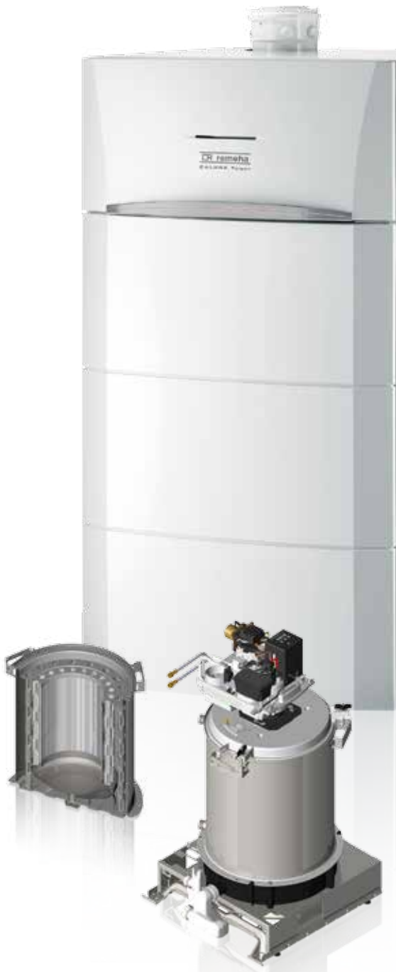
Calora Tower Öl mit Wärmetauscher