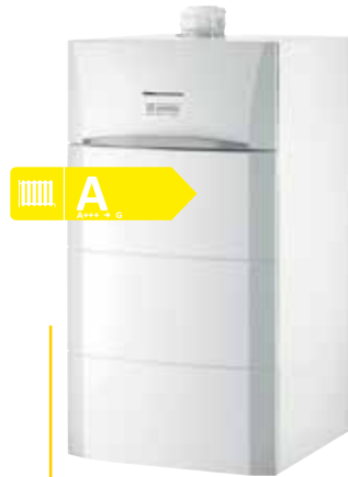
Calora Tower Öl Solo