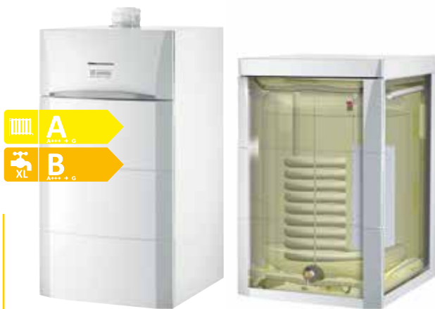
160 SL Speicher beigestellt